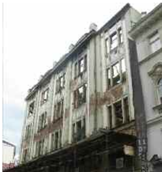
Les restes de la guerre de 1992-1995 sont encore visibles à certains endroits