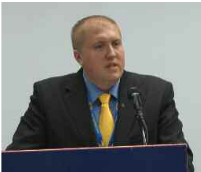
Le président bosnien, Edin Jabancic, lors de la réception du vendredi soir