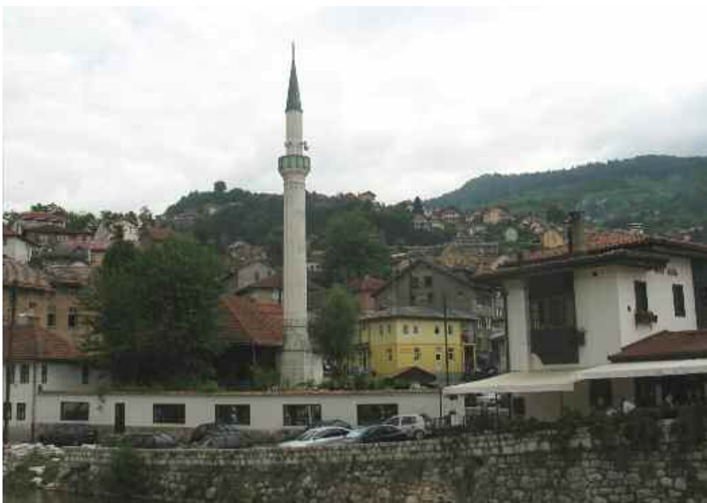
Une des nombreuses mosquées