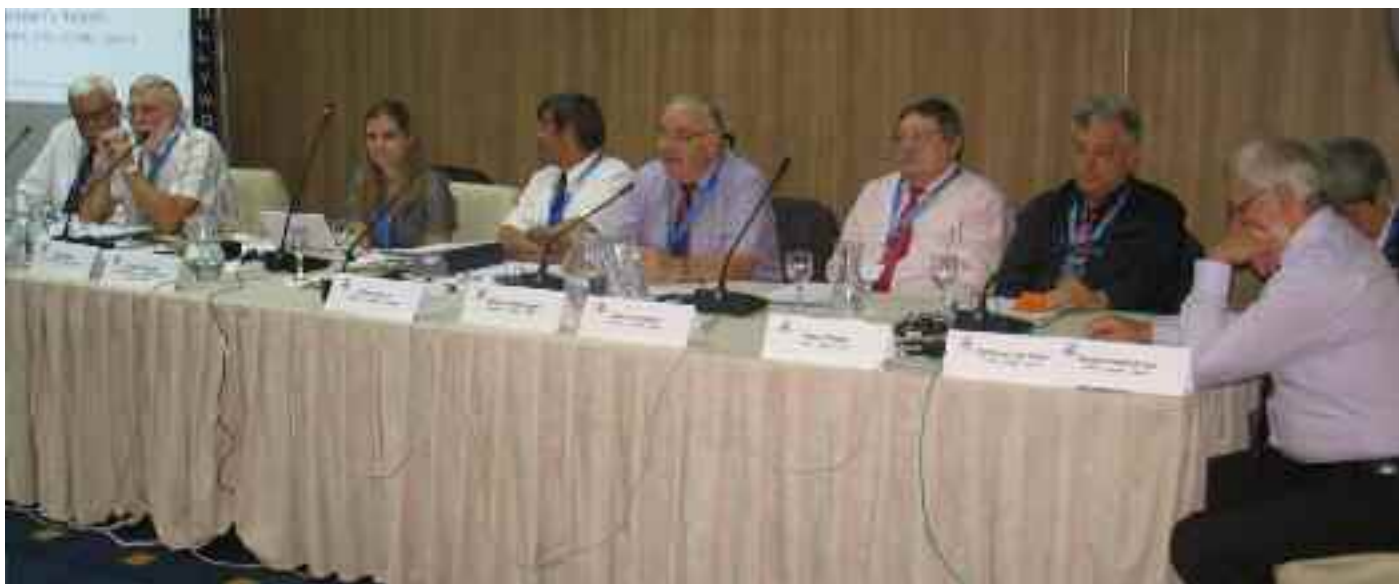
Le comité de l'Entente européenne d'aviculture

et pour les victimes des inondations dans le pays qui nous accueille.