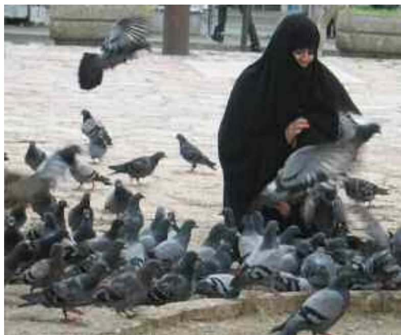
Le nourrissage des pigeons dans la rue