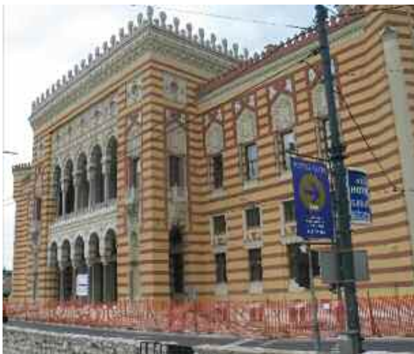
La bibliothèque de Sarajevo