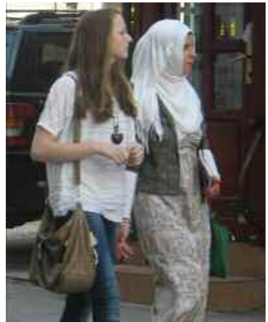
Le mélange des religions et civilisations