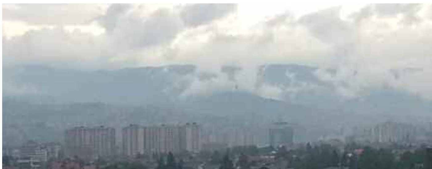
Vue générale de Sarajevo - quartier moderne