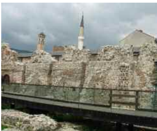
Ci-contre : une rue typique de la vieille ville Ci-dessous à gauche : des ruines de l'époque ottomane Ci-dessous, à droite : le tramway « pittoresque » de Sarajevo