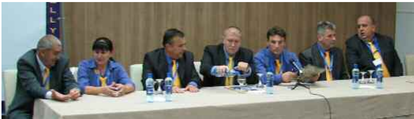
Les membres de la fédération de Bosnie-Herzégovine